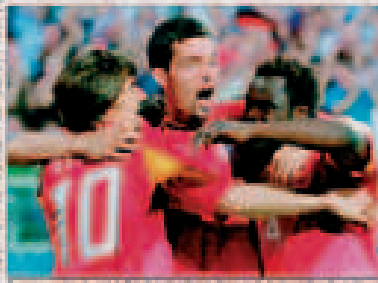
FUSSBALL – DA SCHAUEN FRAUEN WEG. Stimmt nicht. Der Artikel kam bei Frauen auf eine Leserquote von 33 Prozent, bei Männern auf nur 28 Prozent.

Nach verlorenem WM-Finale: Die Spielerinnen sind traurig, aber die Fans sind glücklich.